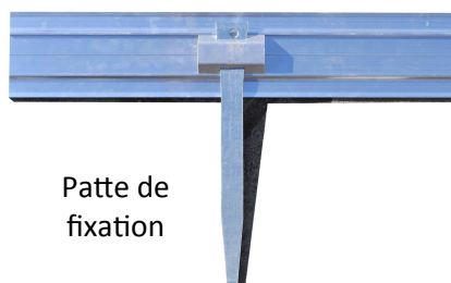
Patte de fixation