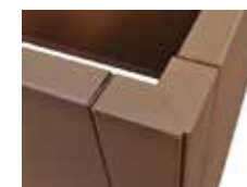
Angle double joint 90°