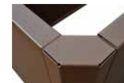
Angle 3 faces 90°