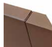
Angle double joint 45°