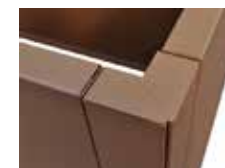
Angle double joint 90°