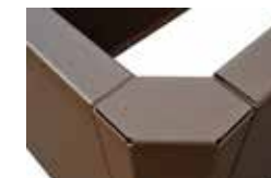
Angle 3 faces 90°